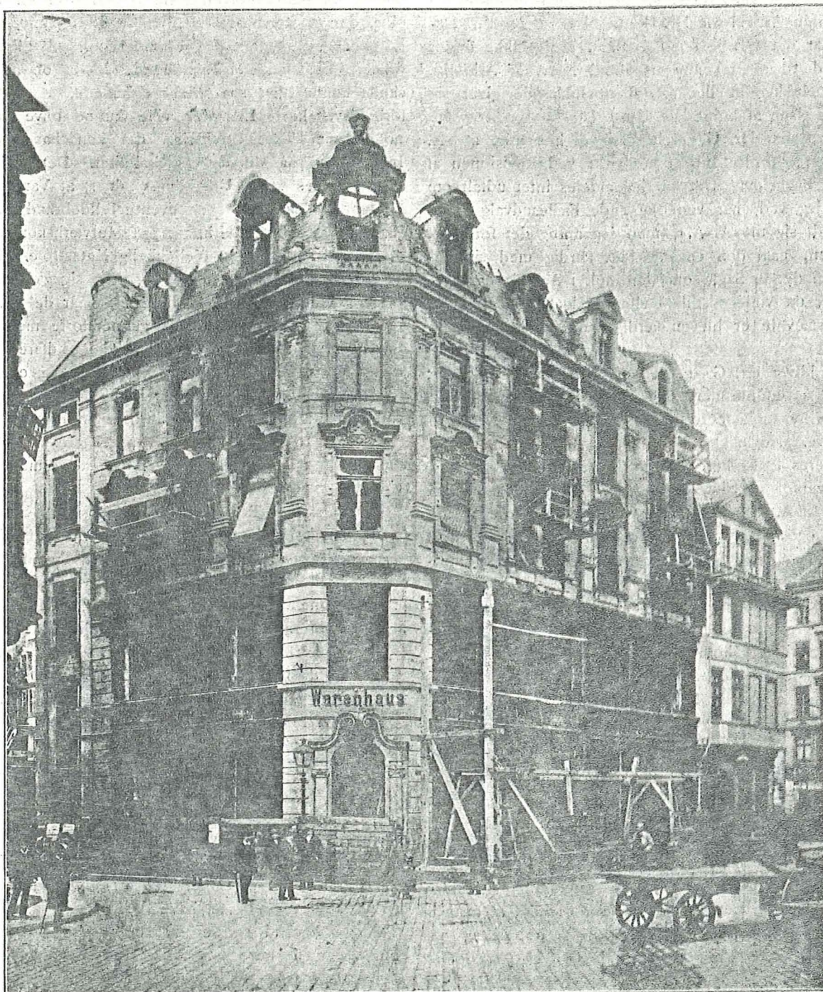
Varehus i Frankfurt a. Main.

Naa, Geværfabrikkens Brand er jo, heldigvis, en i sin